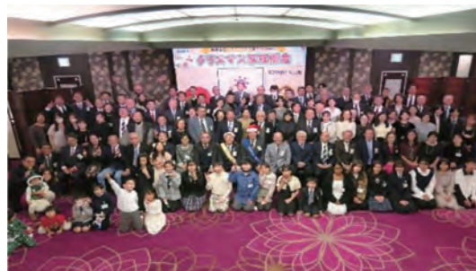
会長挨拶は録音され、ホームページ上に音声添付されています。 http://www.urawahigashi-rc.com/shi_reikai.html