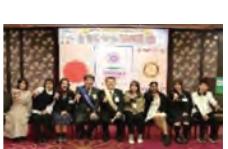
クリスマス家族例会にて HF様のお子様達と