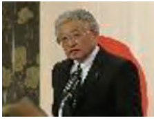
細瀬雅邦ガバナー

卓話は録音され、ホームページ上に音声添付されています。 http://www.urawahigashi-rc.com/shi_reikai.html 浦和東ロータリークラブ→志→例会