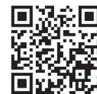
浦和東RC Facebook QRコード