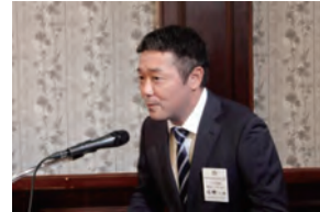
四つのテスト唱和リーダー：北野会員