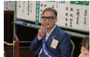
前は八百会員、今回は飯塚会員とお茶目な会員連続インタビューです。