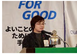
親睦活動委員会三井委員長