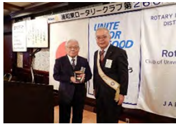
岡村会長と北パスト